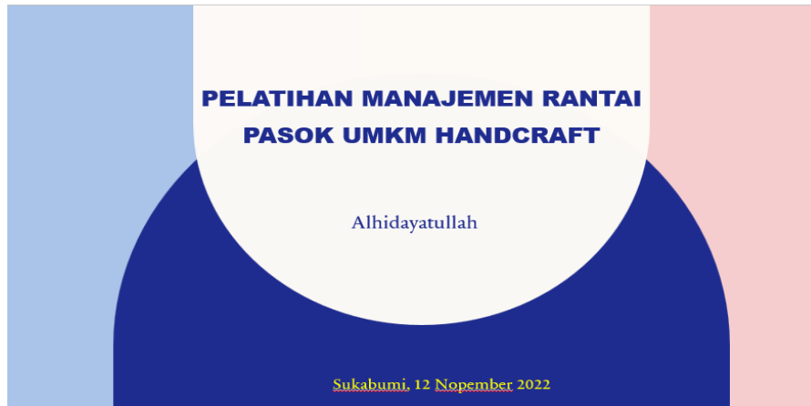
Gambar 1. Pelatihan Manajemen Rantai Pasok (1)

manajemen rantai pasok, serta memahami bagaimana hal tersebut dapat diterapkan pada bisnis mereka (Sembiring et al., 2022).