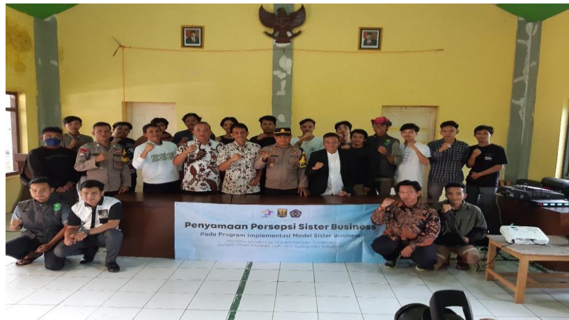
Gambar 6. Pelatihan Manajemen Rantai Pasok (4)