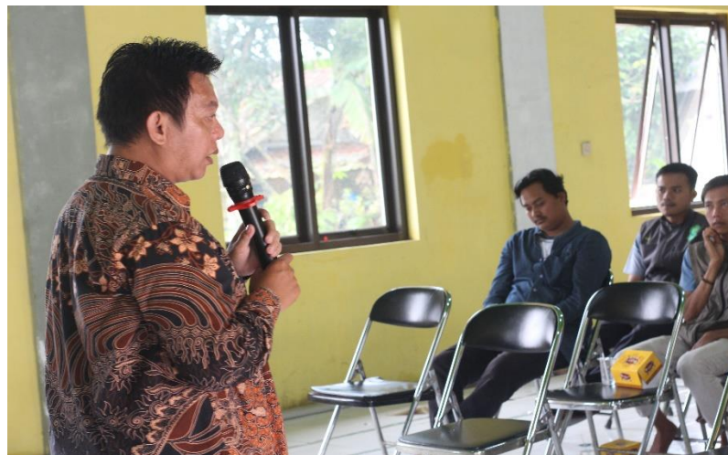
Gambar 2. Pelatihan Manajemen Rantai Pasok (2)