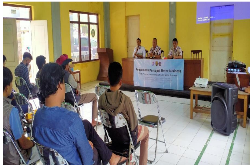
Gambar 4. Peningkatan Koordinasi Pelaku Bisnis