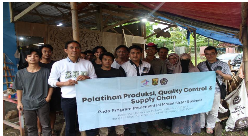
Gambar 5. Pelatihan Manajemen Rantai Pasok (3)

Evaluasi ini menjelaskan bahwa peserta pelatihan mengerti dan memahami isi materi yang disampaikan.