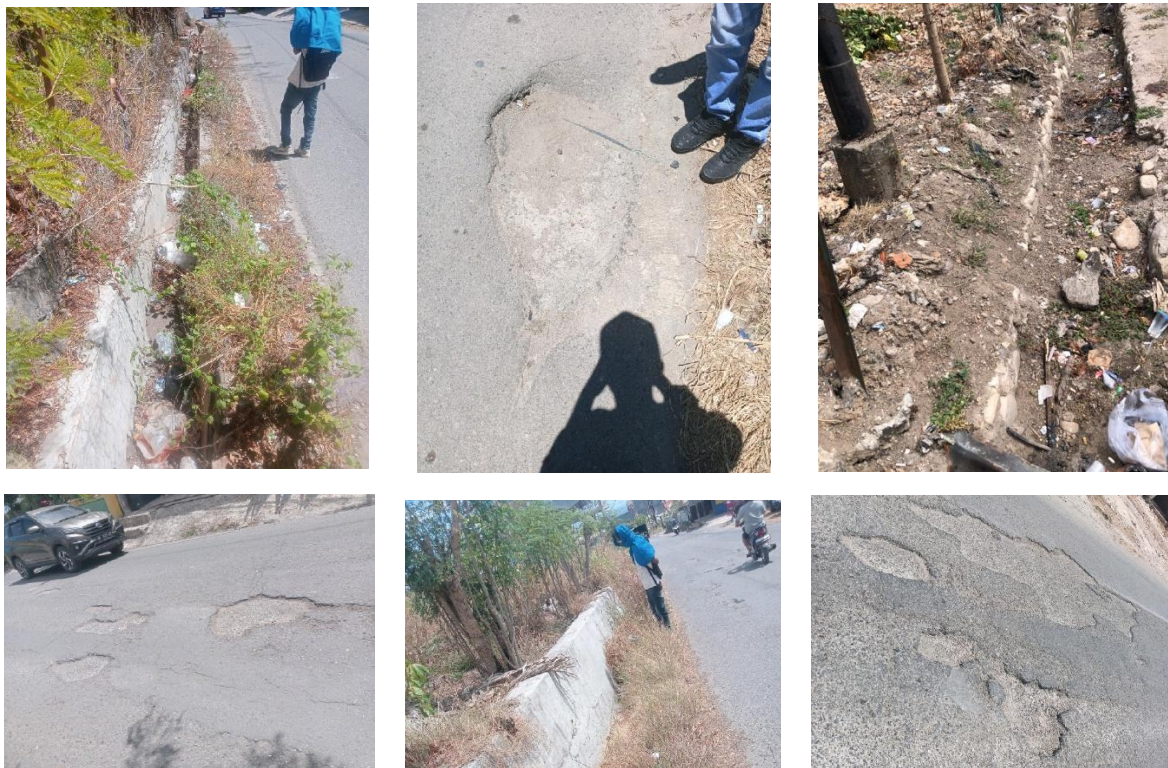
Gambar 1 Dokumentasi Survey Titik Kerusakan

Survei lapangan yang dilaksanakan oleh tim KKN Kolaborasi UNWIRA-DIT berhasil mengidentifikasi sebanyak 204 titik kerusakan di sepanjang ruas Jalan Fektor Funay. Titik-titik kerusakan tersebut tersebar pada 26 segmen STA (STA 0+000 hingga STA 25+000) dengan interval 100 meter. Kerusakan yang ditemukan terdiri dari enam jenis, yaitu lubang (61 titik; 29,9%), kerusakan tepi (52 titik; 25,5%), kerusakan drainase (49 titik; 24,0%), retak (20 titik; 9,8%), kerusakan bahu jalan (19 titik; 9,3%), dan alur/rutting (3 titik; 1,5%). Total kerusakan perkerasan (tidak termasuk drainase) berjumlah 155 titik yang digunakan sebagai input analisis KDE.