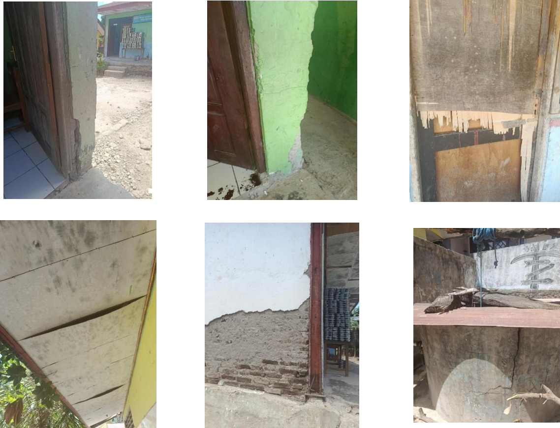
Gambar 3. Dokumentasi Kondisi SD Inpres Sikumana 3

Berdasarkan peringkat indeks kondisi, SMPN 12 Kupang memiliki indeks terendah (1,92) dan menjadi prioritas utama untuk segera direhabilitasi. Kondisi kritis ditemukan pada komponen kolom dan balok, atap yang bocor dan berkarat, plafon yang berlubang, serta fasilitas toilet yang kurang layak pakai. Mengingat sekolah ini melayani ratusan siswa setiap harinya, kondisi tersebut tidak hanya mengganggu proses belajar mengajar tetapi juga berpotensi membahayakan keselamatan siswa dan tenaga pengajar.