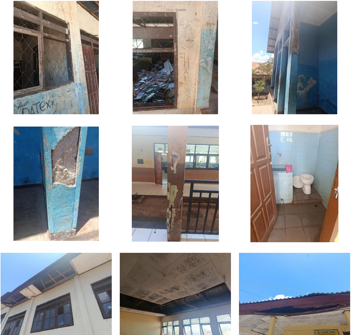
Gambar 2. Dokumentasi Kondisi SMPN 12 Kupang

https://doi.org/10.61492/jpmmocci.v4i1.518